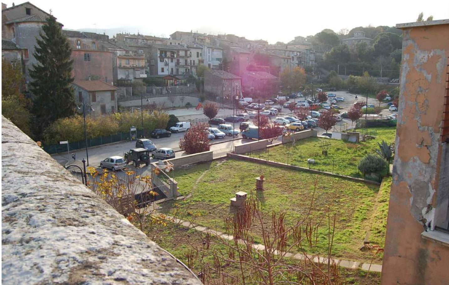
FOTO 02_VISTA AREA A PARCHEGGIO VALLE PIERINA