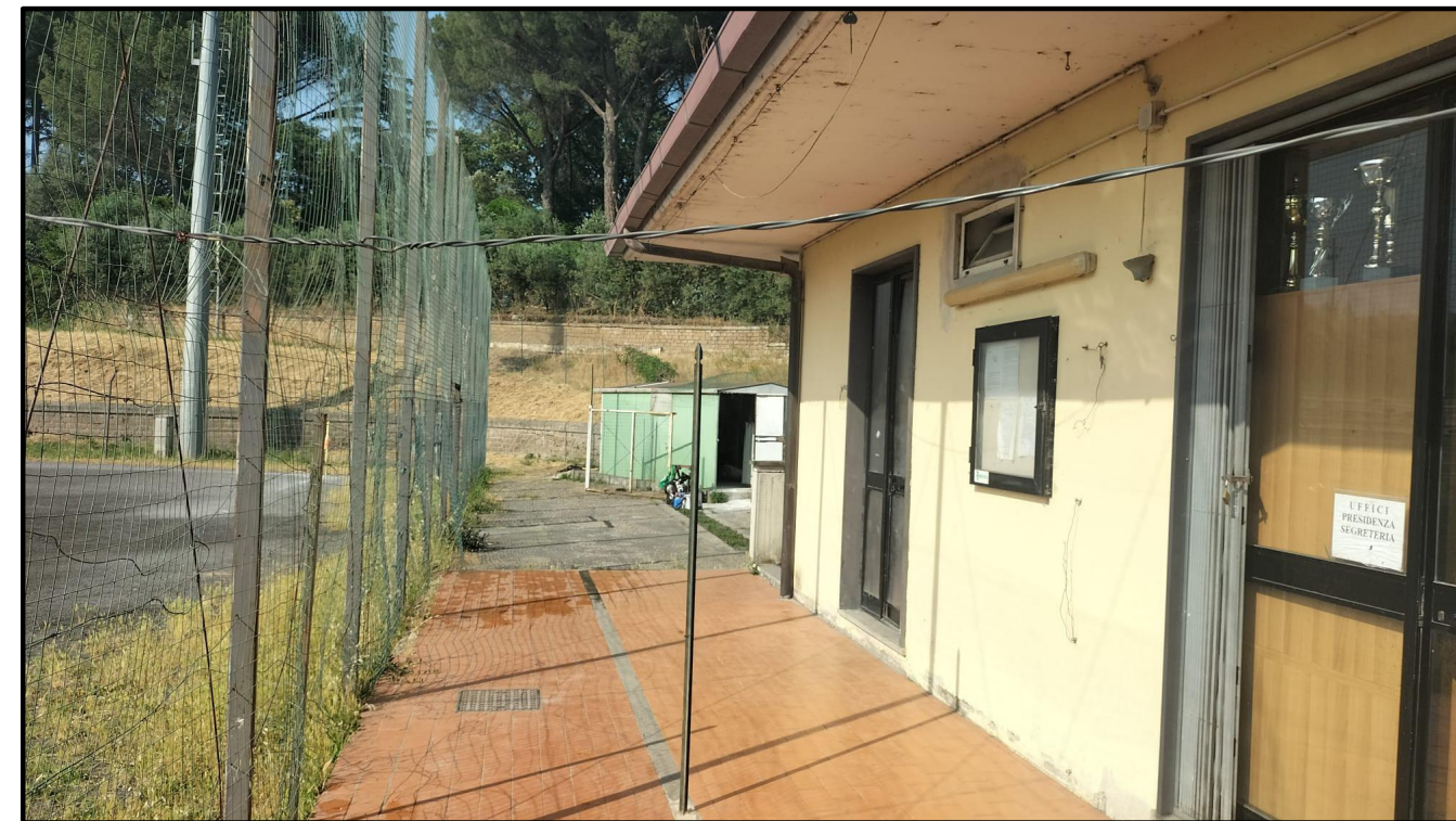
edificio 1 - spogliatoi

*Gli spogliatoi 1 e 2 sono compartimentabili per l'utilizzo come spogliatoi dell'adiacente campo di calcio a 5, realizzato successivamente. Per le partite di calcio a 11 sono da considerare come spogliatoio unico in quanto separati da porta