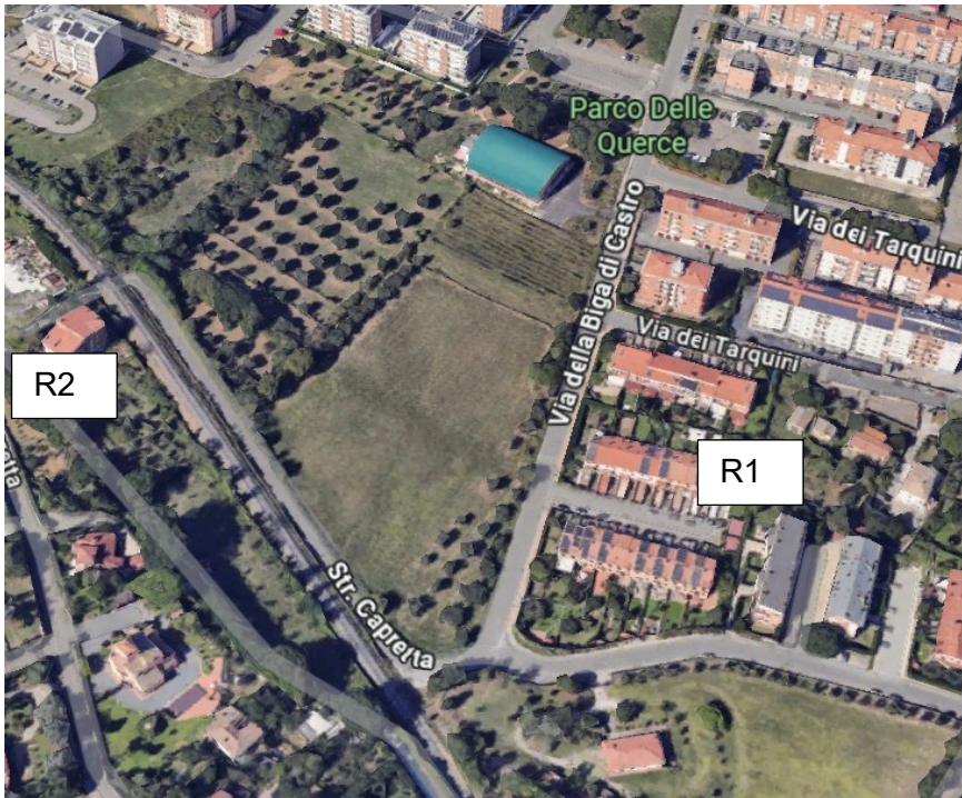
figura 2 – ortofoto con indicazione dei ricettori così come da precedenti monitoraggi