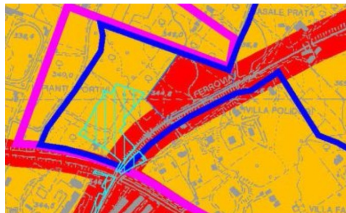
figura 3 - estratto della Zonizzazione Acustica del Comune di

Viterbo e relativa legenda figura 4 - legenda della Zonizzazione Acustica