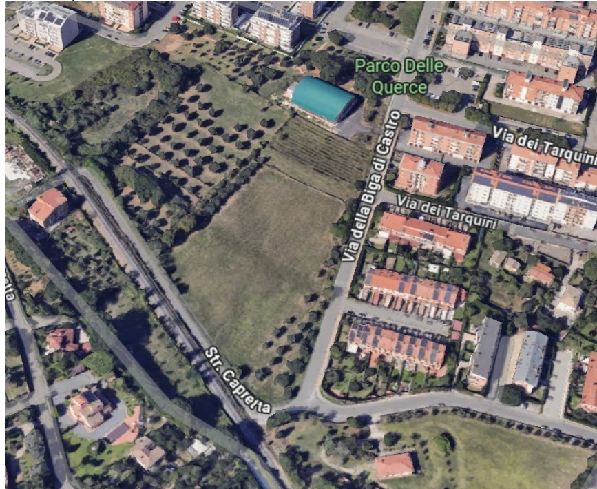
figura 1 – ortofoto con individuazione in rosso dell'area di pertinenza dello Skatepark